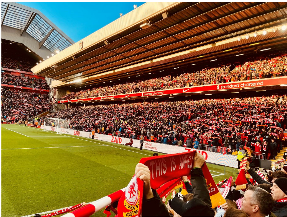
Beispieldarstellung Anfield Road Stadium

Stadion-Adresse: Anfield Rd, Anfield, Liverpool L4 0TH, Vereinigtes Königreich